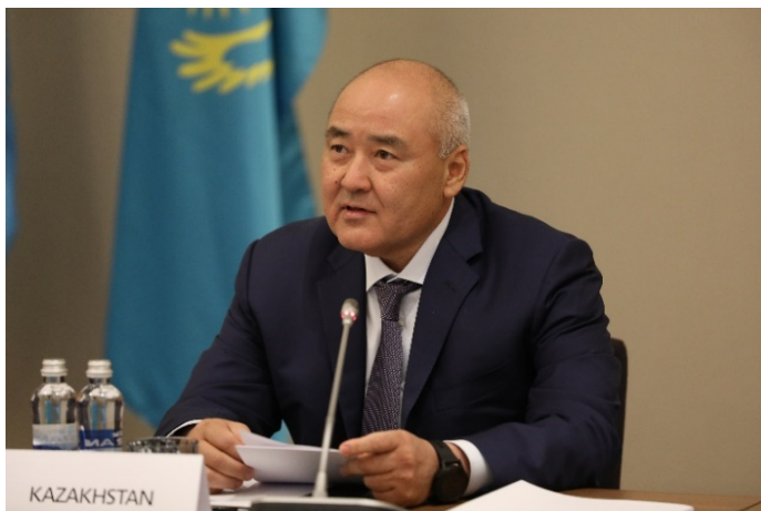
Г-н Умирзак Шукеев, Заместитель Премьер-Министра – Министр сельского хозяйства Республики Казахстан

Заседание Круглого стола министров по восстановлению лесных ландшафтов и Боннскому вызову на Кавказе и в Центральной Азии было официально открыто г-ном Умирзаком Шукеевым, Заместителем Премьер-Министра и Министром сельского хозяйства Республики Казахстан . От имени Правительства Республики Казахстан г-н Шукеев приветствовал всех делегатов и наблюдателей в Астане и пожелал участникам Круглого стола продуктивной работы. Г-н Шукеев добавил, что проведение этого мероприятия в г. Астана является большой честью для Республики Казахстан.