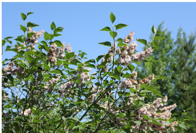
Сирень венгерская ( Syringa josikaea ) в лесопитомнике «Ак кайын»

Для выращивания сеянцев в посевном отделении предусматривается четырехпольный севооборот с двумя паровыми полями (сидеральными, занятыми). Севооборот обозначает последовательную культивацию различных сельскохозяйственных культур в определенном порядке на одних и тех же полях, что способствует восстановлению и повышению плодородия почвы. В качестве сидерата используется донник желтый ( Melilotus officinalis ). С целью создания благоприятных условий для прорастания семян, появления дружных всходов и роста сеянцев проводят различные виды уходов. Например, уходы до появления всходов заключаются в прополке сорняков, культивации почвы и поливе. Орошение питомника, в условиях его месторасположения, является условием успешности выращивания посадочного материала.