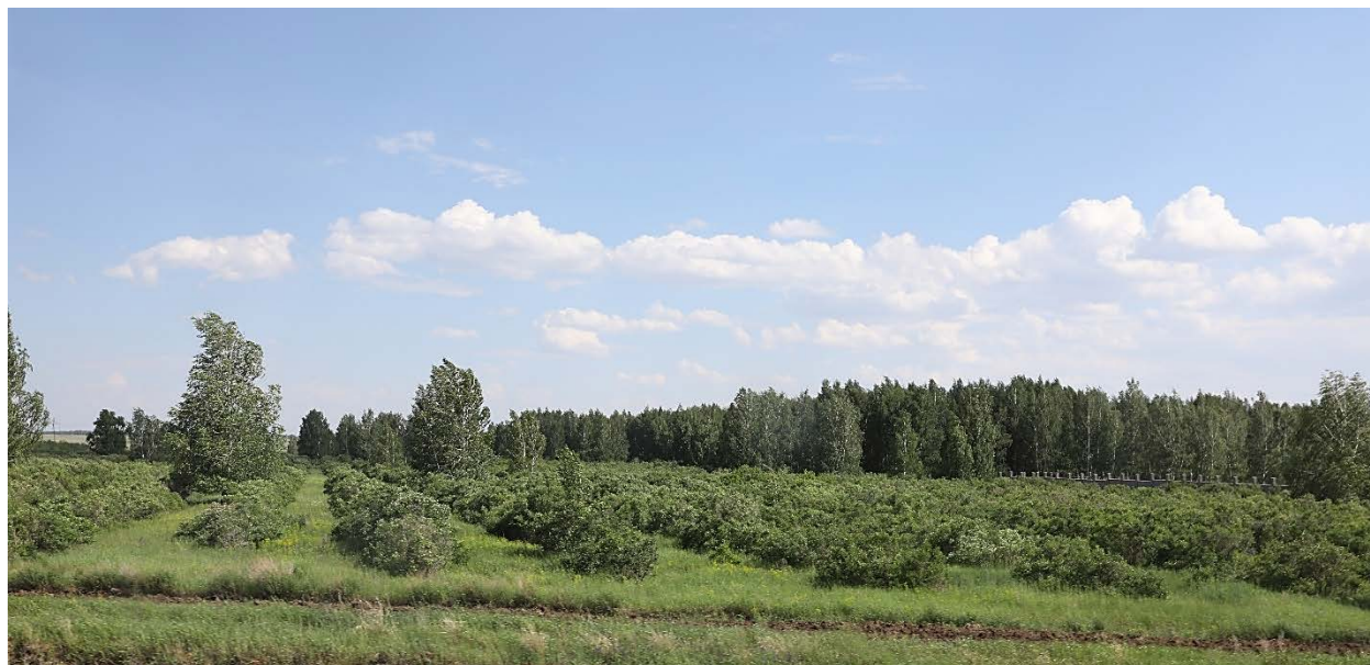
Часть зеленого пояса Астаны

Последним пунктом экскурсии по зеленой зоне г. Астана была зона отдыха «Бал Карагай». В настоящее время, база «Бал Карагай» является одним из 28 лесопользователей, которые осуществляют рекреационно-оздоровительную и спортивную деятельность на территории Государственного лесного фонда, окружающей г. Астана (зеленый пояс).